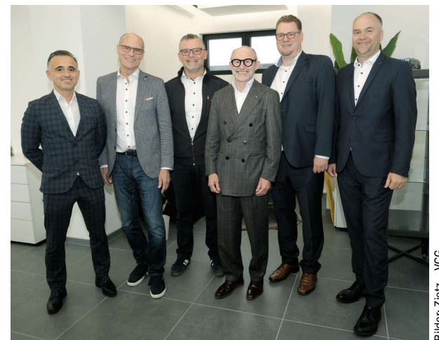
Die Nürnberger Automobil als wichtiger Partner des Gewerbes betreibt eine Versicherungsagentur im Verbandshaus.